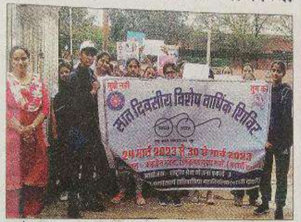
शहर में रैली निकालतीं जनता कॉलेज की स्वयंसेविकाएं। संबद